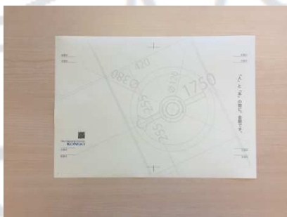
1. Bookカバーを用意します。