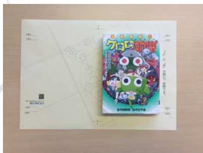
2. 本の高さに印をつけます。