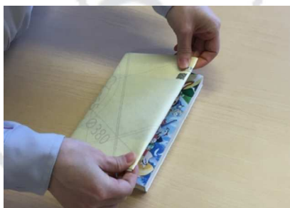
6. Bookカバーに表紙を差し込めば