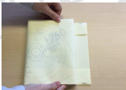
5. 両端を本に合わせて折ります。