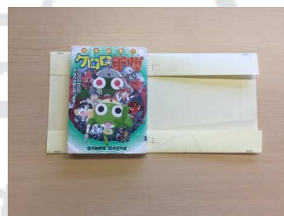
4. 中央線の上に本を置きます。