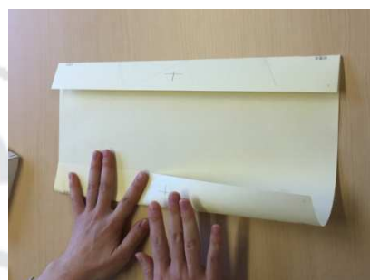
反対側も同じように