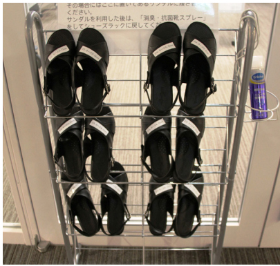
地下1階書庫入口に設置された履き替え用サンダル