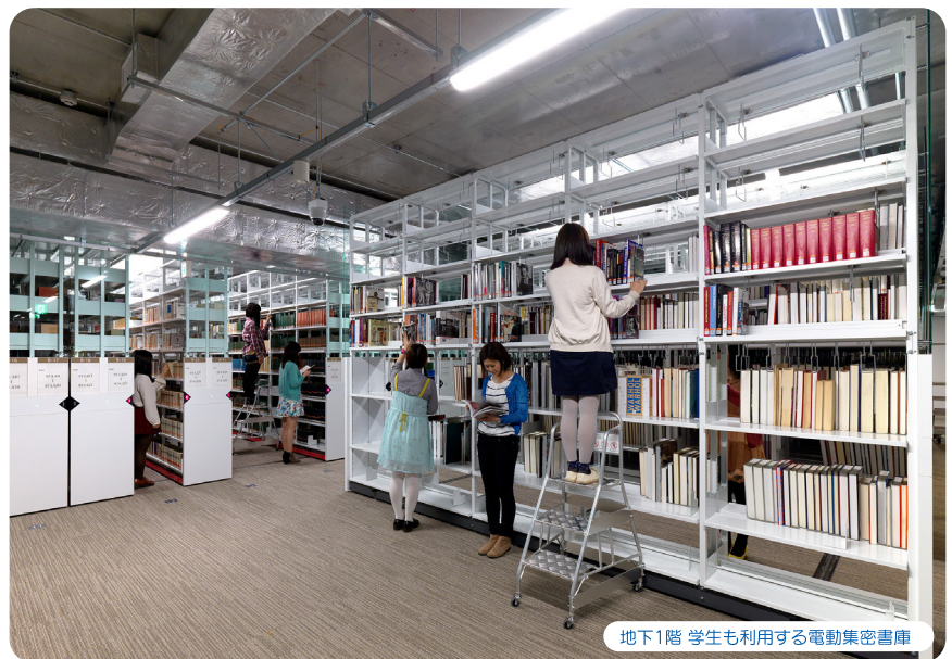
地下1階 学生も利用する電動集密書庫

こうして準備した図書を2月に渋谷図書館へ移動する際には、45年ぶりと言われた大雪と重なるというハプニングにも見舞われました。無事に搬入したも