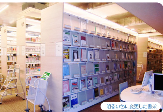
明るい色に変更した書架

そうすると収容冊数が減ってしまうので、書架の段数を増やしたのですが、高さが増すと書架の圧迫感が出てしまいます。その対策として、当初計画していたシックで落ち着いた色の木製パネルではなく、白に近い明るい色の木製パネルを用いた書架に変更し、圧迫感を軽減しました。