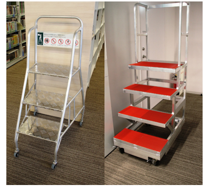
非常に軽量のステップ(左:3段/右:4段)

まず、入館者数は昨年同月に比べて非常に多くなっています。4月は文学部で昨年の約4,000人から約6,500人に、人間社会学部で昨年の約1,800人から約2,800人に、短期大学部の日本語コミュニケーション学科では昨年の約550人から約1,200人に、英語コミュニケーション学科は昨年の190人から900人に増加しました。都市型キャンパスのビル空間の中でゆっくり過ごせる場所のひとつとして図書館が認知されたことが、利