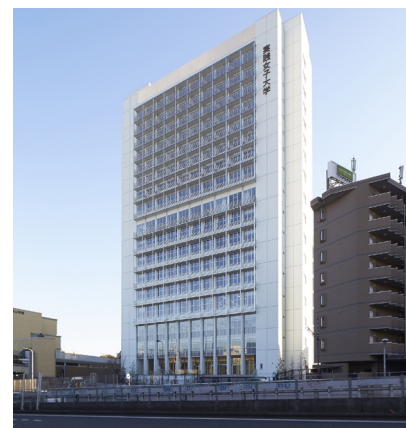
新キャンパス外観

3階の3フロアから成り、延べ床面積2,500平米、蔵書数約16万冊(収容可能数26万冊)、席数278席(グループ学習室・ソファ席・PC席含む)となっています。基本的に、2階は「プライベートゾーン(個人閲覧室)もある静寂な空間」がコンセプトの図書館メインフロアです。3階は「人と情報が触発し合うオープンスペース」