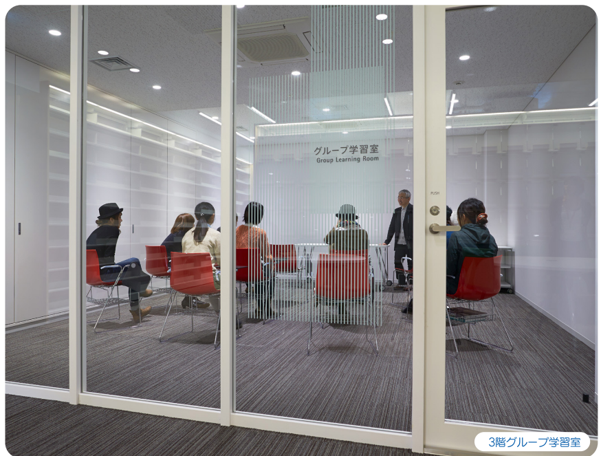
3階グループ学習室